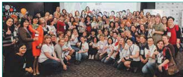
Нетворкинг «Другого формата».

Кроме семинаров по современным образовательным практикам, выступлений спикеров и нетворкинга, в программу «Другого формата» включили блок, посвященный повседневной жизни педагогов. Например, пригла-