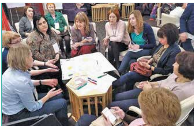
Участники Региональной школы.