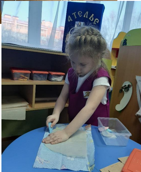
Рис.8 Создаем выкройку шапки