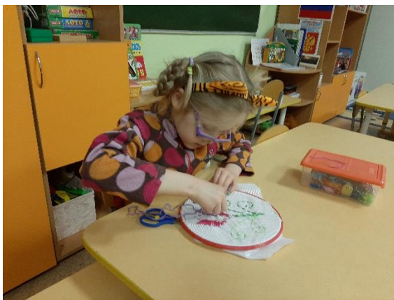
Рис.10 Вышиваем гладью салфетку для мамы