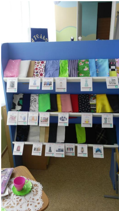
Рис.3 В приемной швейного ателье