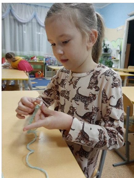
Рис.12 Вязка крючком