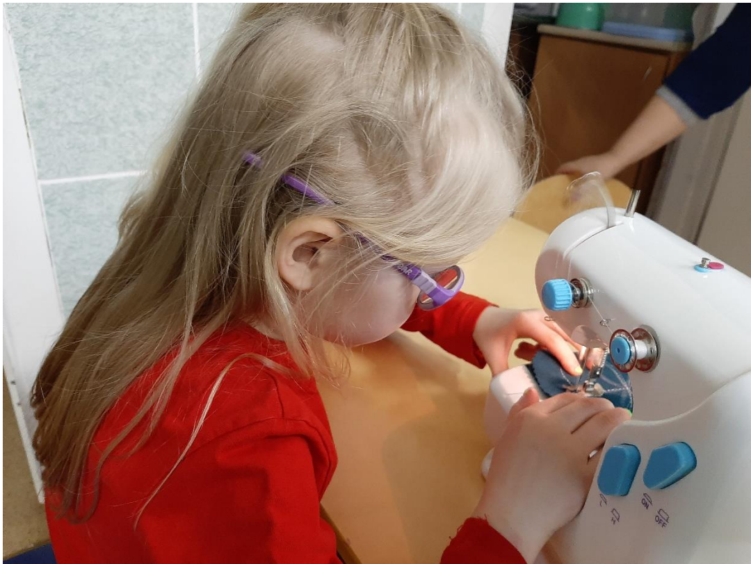
Рис.9 Шьем прихватки для помощника воспитателя на швейной машинке