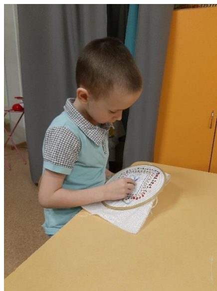
Рис.13 Вышиваем швом «Вперед иголкой»