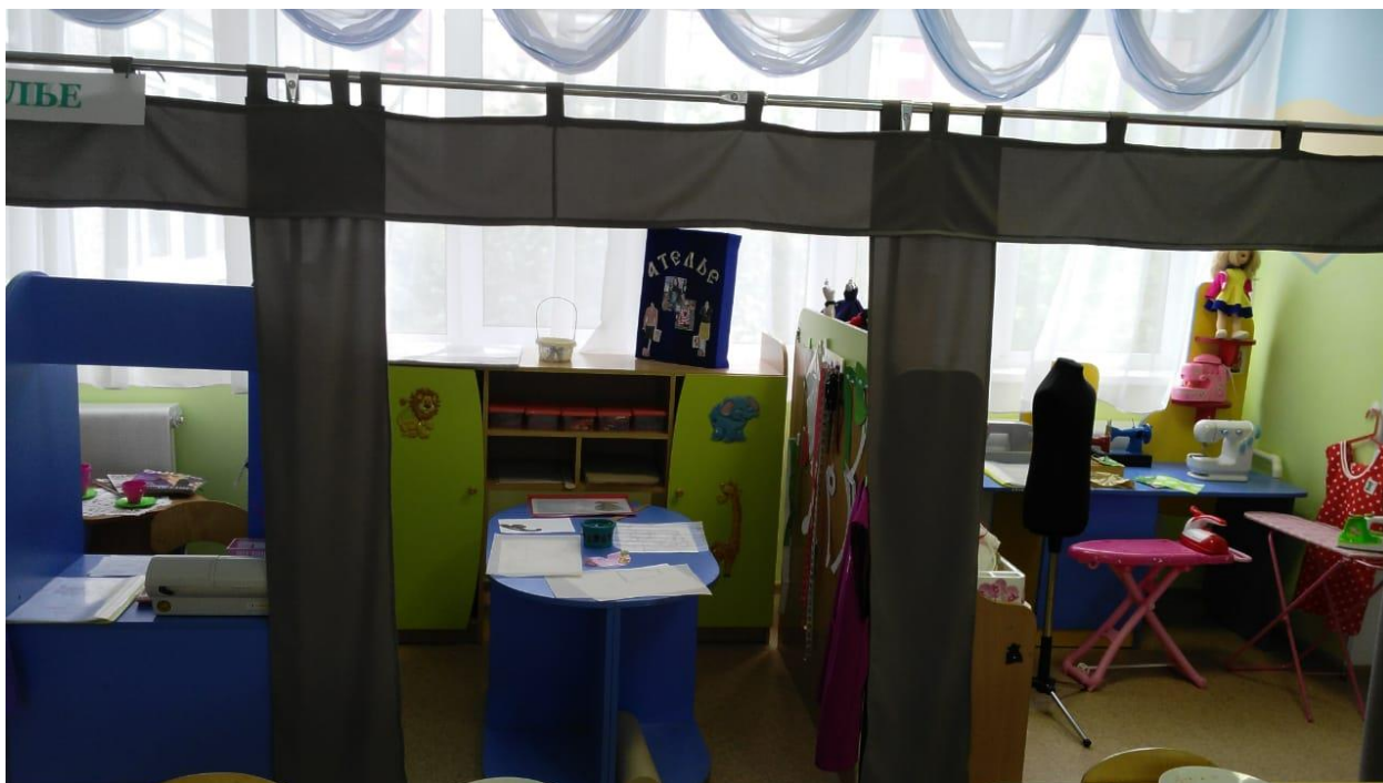
Рис.1 Швейное ателье. Панорамный снимок.