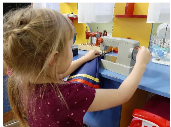
Рис.6 Игровая ситуация – зашиваем юбку