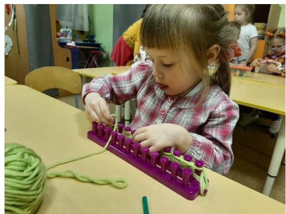
Рис.11 Вязка на станке для вязания