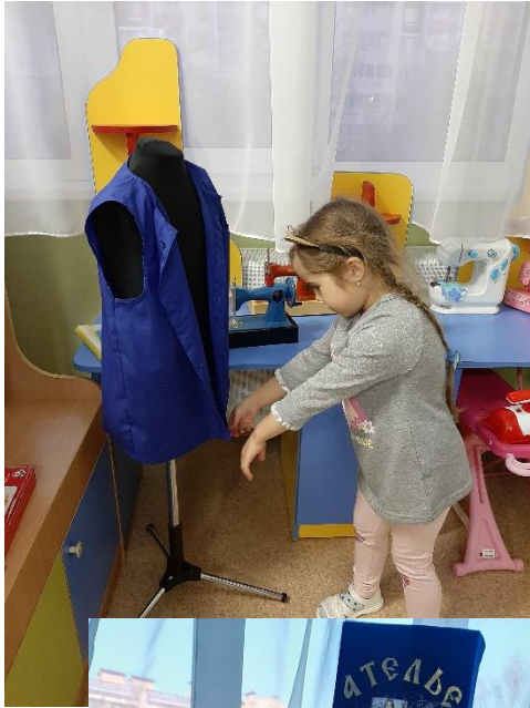
Рис.7 Игровая ситуация – проверяем изделие