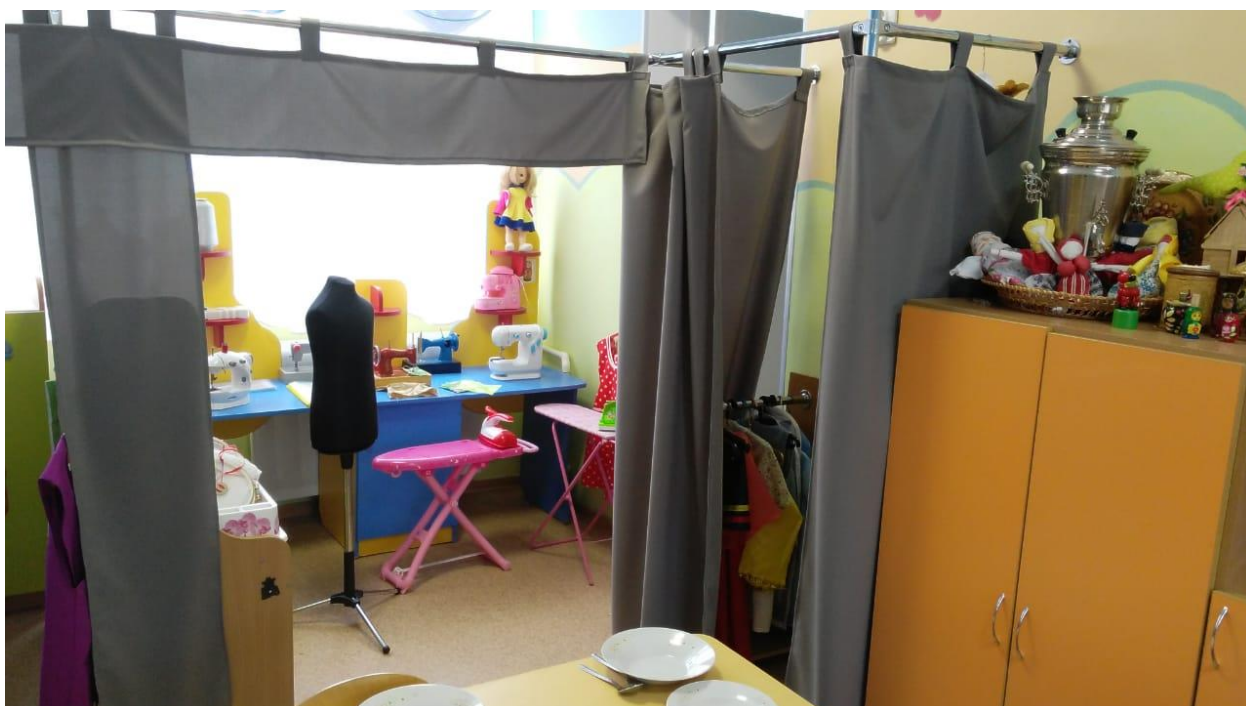
Рис.2 Пошивочный цех и примерочная.