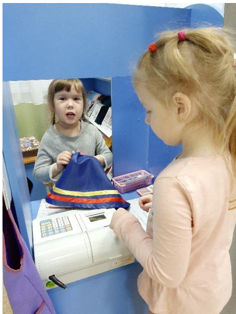
Рис.5 Администратор принимает заказ