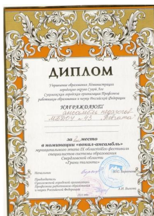
IX областной феиваль специалистов системы образования Свердловской области «Грани таланта»