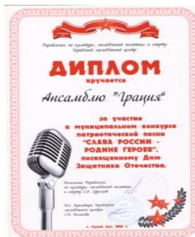
Муниципальный конкурс патриот