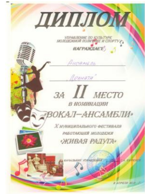
X муниципальный фестиваль работающей молодежи «Живая радуга»