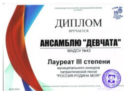
Муниципальный конкурс патриотической песни «Россия – Родина моя!»