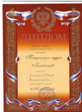
X Районный фестиваль работающей молодежи «Живая радуга»