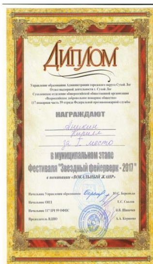
Муниципальный этап фестиваля «Звездный фейерверк – 2017»