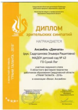
X Областной фестиваль творчества работников образования Свердловской области «Грани таланта – 2016»