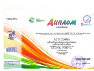
XI районный фестиваль творчества работающей молодежи «Живая радуга»