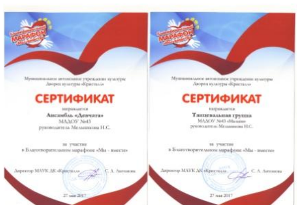
Благотворительный марафон «Мы – вместе»