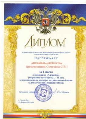
Муниципальный конкурс патриотической песни «Слава России – Родине героев»