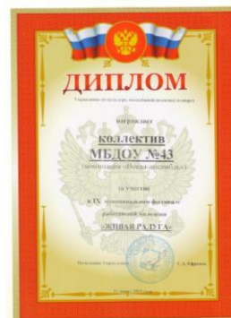
IX муниципальный фестиваль работающей молодежи «Живая радуга»