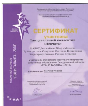
XI областной фестиваль «Грани таланта – 2018»