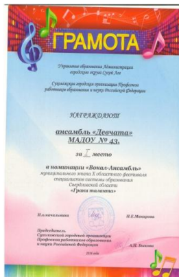
Муниципальный этап X Областного фестиваля творчества работников образования Свердловской области «Грани таланта»