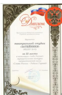
Муниципальный конкурс патриотической песни «Слава России – Родине героев»