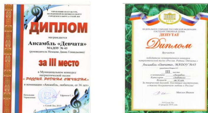
Муниципальный конкурс «Россия. Родина. Отчизна.»