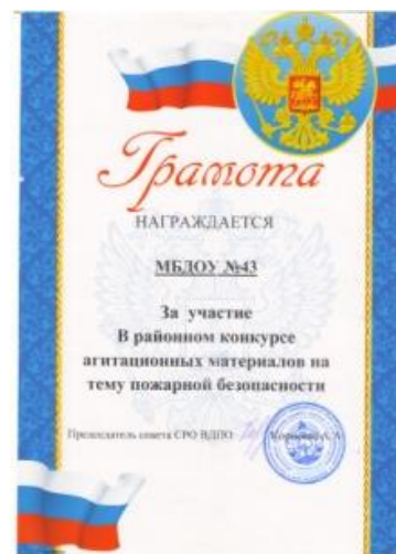
Районный конкурс агитационных материалов на тему пожарной безопасности