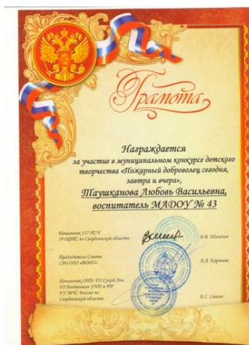
Муниципальный конкурс «Пожарный доброволец сегодня, завтра и вчера»