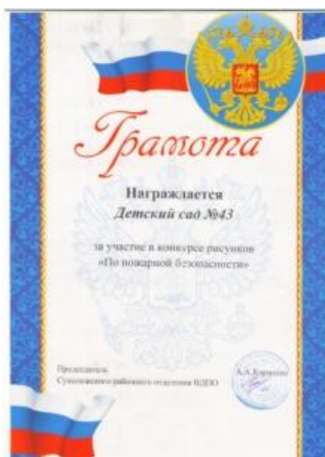
Конкурс рисунков «По пожарной безопасности»