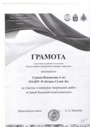
Конкурс творческих работ «Самый большой огнетушитель»