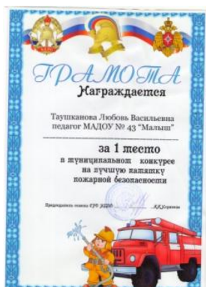
Муниципальный конкурс на лучшую памятку пожарной безопасности