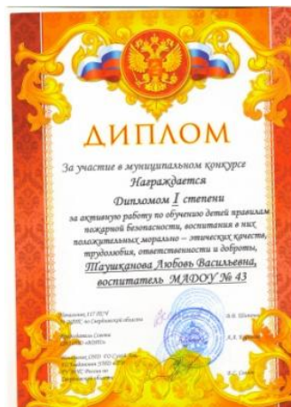
Муниципальный конкурс по обучению детей правил пожарной безопасности