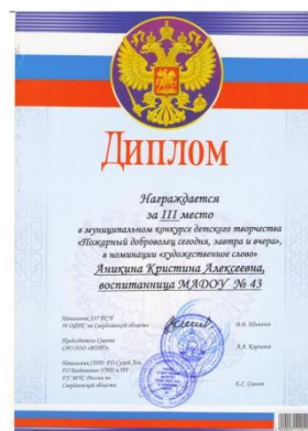
Муниципальный конкурс детского творчества «Пожарный доброволец сегодня, завтра и вчера»