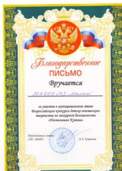
Муниципальный конкурс «Неопалимая Купина»