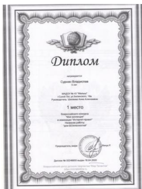
Всероссийский конкурс «Моя коллекция»