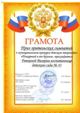
Муниципальный конкурс детского творчества «Пожарный и его друзья»