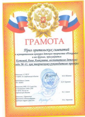
Муниципальный конкурс «Пожарный и его друзья»