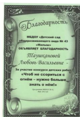
Конкурс детских работ «Чтоб не ссориться с огнем – нужно больше знать о нём!»