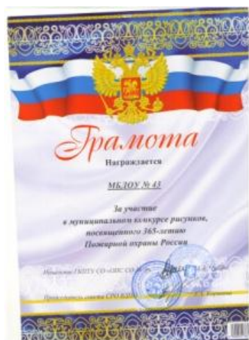
Муниципальный конкурс рисунков, посвященный 365-летию Пожарной охраны России