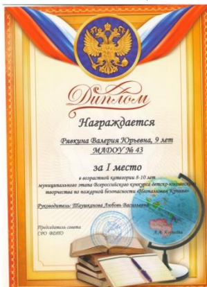
Всероссийский конкурс детско-юношеского творчества по пожарной безопасности «Неопалимая Купина»